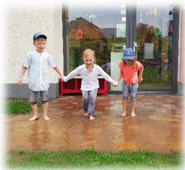
Auf die Plätze....

Ein weiterer großer Punkt unserer Grundhaltung ist die Bewegung und das Naturerleben. Den Kindern wird die Möglichkeit gegeben ihrem Bewegungsdrang nachzugehen und sich auszupowern. Beispielsweise dürfen sie in der Freispielzeit jederzeit in den Turnraum oder die Vorschulkinder alleine auf das Außengelände. Durch die großen Fensterfronten haben wir die Kinder hierbei immer im Blick. Durch regelmäßige Besuche in der Natur wird der Entdeckergeist der Kinder unterstützt.