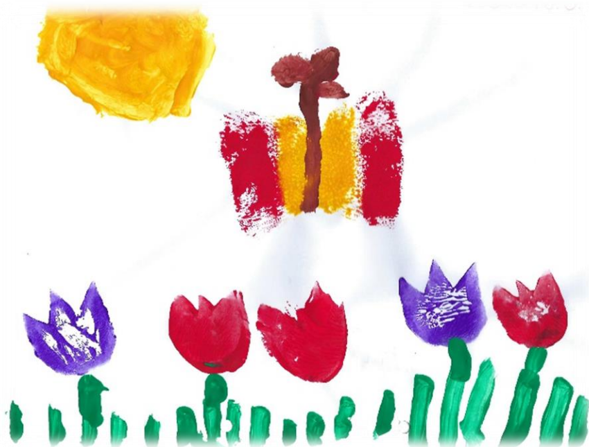
Rosalie (4 Jahre)

Ab 14.00 Uhr beginnt die Abholzeit. Den Nachmittag verbringen die Kinder mit Freispiel, Angeboten oder auf dem Außengelände. Gegen 14:30 Uhr können die Kinder einen Snack einnehmen und werden bis spätestens 16.30 Uhr (freitags bis 15.00 Uhr) abgeholt.